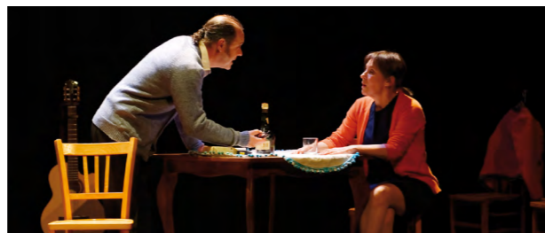
Témoignages d'aidants mis en scène par la compagnie théâtrale ERGATICA lors de la journée de lancement