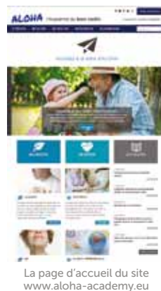
La page d'accueil du site www.aloha-academy.eu

Parce que nous sommes tous concernés par le vieillissement, nous devrions tous nous diriger un jour ou l'autre sur cette plateforme éducative.